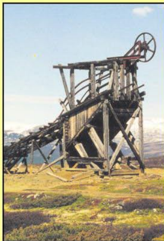
Det gamle gruветårnet ved Grdalsgruven. 2004.