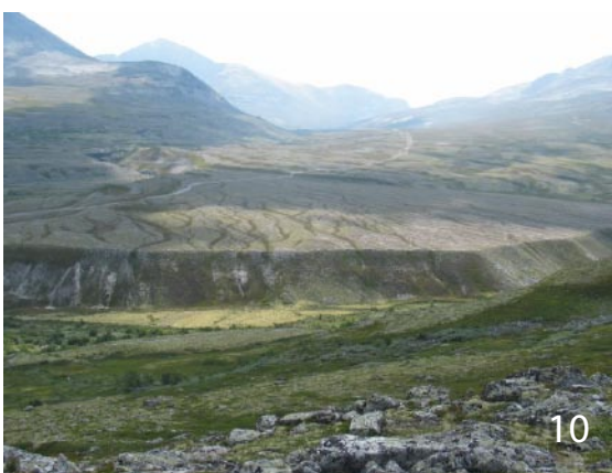
Lokalitet 10. Kart koordinater: 5410 68725